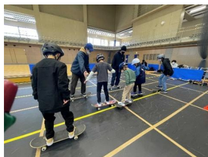
屋内でのアーバンスポーツ利用