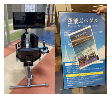
地元企業の商品開発に協力 「空飛ぶベダル」